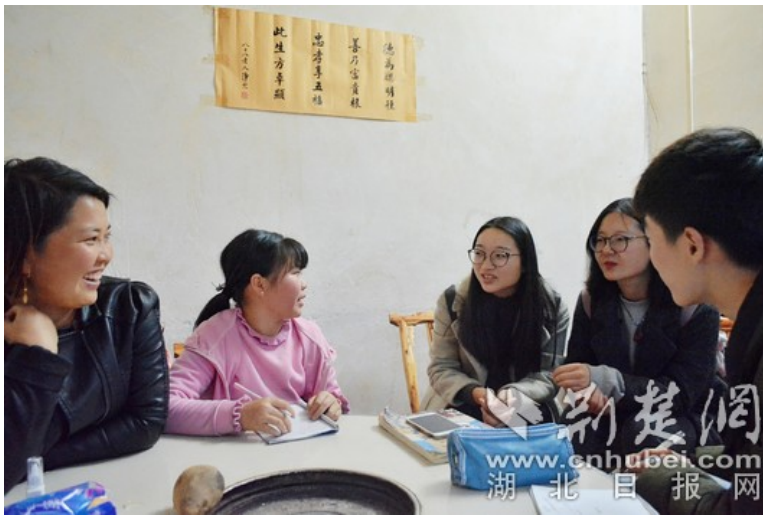
湖大通识师生走访赵家山村村民

广场旁设有“红白理事会”，作为村民办理婚嫁、丧葬的固定场地。赵家山村倡导社会主义精神文明，婚丧嫁娶不大操大办。理事会里固定设桌20张，并限制村民的消费，以遏制村民的攀比心理，提倡勤俭节约，树立良好的社会主义新风尚。