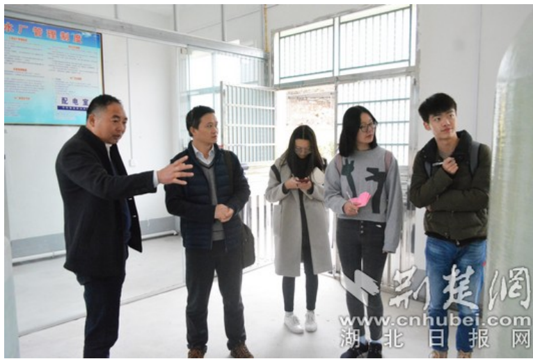
湖大通识师生走访赵家山水厂

2016年9月18日水泵安装成功，但是村里20%的村民饮水难问题仍未解决，且水质容易富氧化，饮水仍不“放心”。