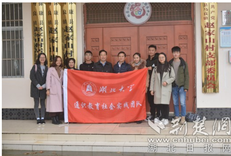
湖大通识师生走访赵家山村