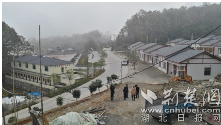
保康县赵家山村集中安置房和文化广场

为保障水质，赵家山村建起了水厂，配备了降氟和消毒设备，进行二次取水后再供村民饮用。如今，赵家山水厂日出货量达120立方米，赵家山和临近的苏家寨、云旗山、张家岭等自然村2000多人彻底告别了吃水难的历史。