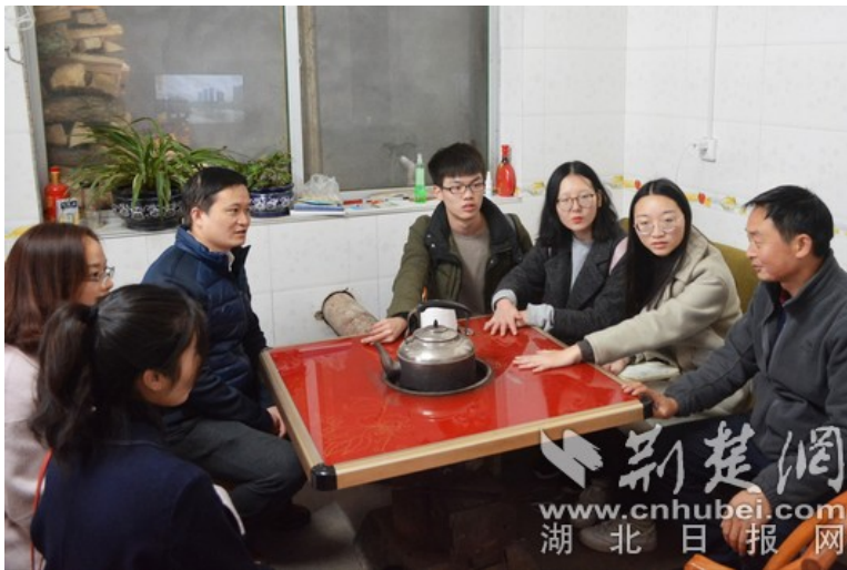
湖大通识师生走访赵家山村村民

在各级党委、政府的大力支持和关心下，赵家山村成为拥有“全县易地扶贫搬迁示范点”“文化小康示范村”等多面红旗的“示范村”，当地村民正在享受着精准扶贫带来的幸福生活。