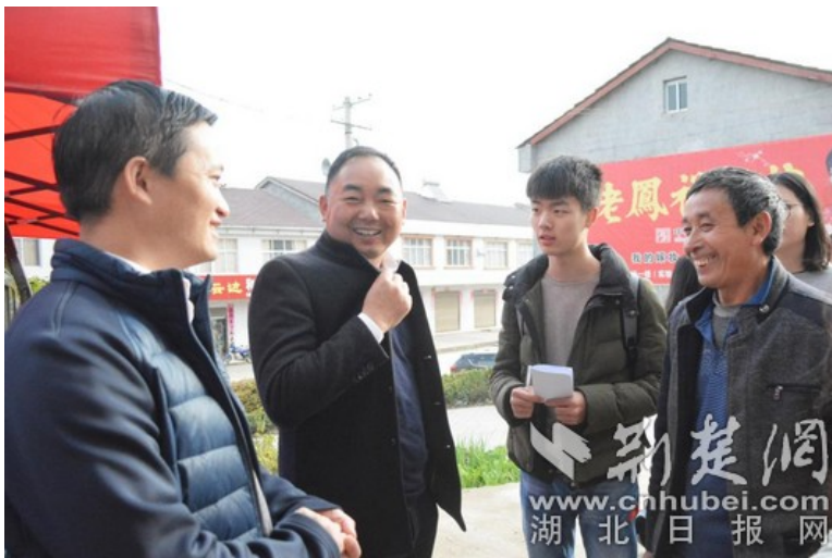
湖大通识师生走访赵家山村村民

2017年，村委会组织集资，修建了9个设备齐全的卧密式烤房，可供150亩烟叶田地使用，烤房的修建便利了村民烘干烟叶。村委会还积极招商，让村民们与商家协商供量和价格，签署合同，确保销路，将烟叶种植引上标准化道路。