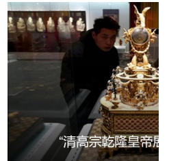
“清高宗乾隆皇帝展