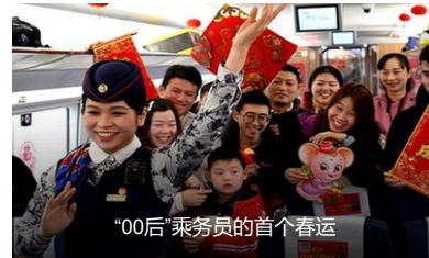
“00后”乘务员的首个春运