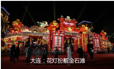
大连：花灯扮靓金石滩