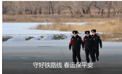
守好铁路线 春运保平安