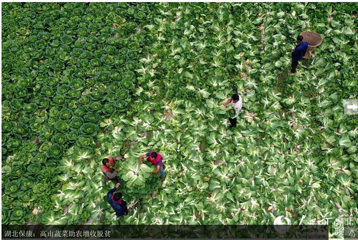
湖北保康：高山蔬菜助农增收脱贫