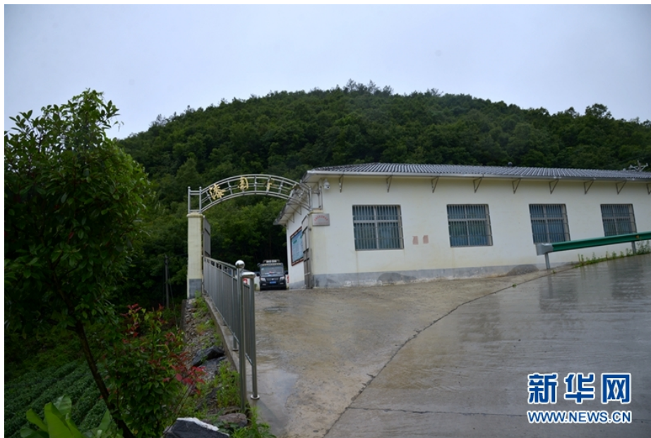
保康县马良镇漆园村水厂。

新华网武汉7月28日电（肖进安、赵梦琪、周干茹）在湖北襄阳几个山区县采访，讲到以前吃水难的故事，当地基层干部说三天三夜都讲不完。目前，“吃水难”问题在襄阳山区已经基本得到解决，总体实现了从喝水难到有水喝、再到喝好水的巨大变化。而保康县马良镇漆园村在地下1030米成功“深井取水”，期间一波三折，故事今天听起来仍然让人震撼。