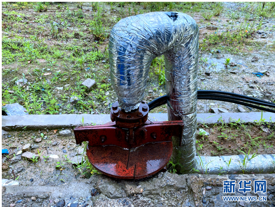
保康县马良镇漆园村漆园村“深井”取水点。

“喀斯特地貌注定无法打井取水。”这曾被不少专家盖棺定论。2017年，为破解喀斯特地貌地区安全饮水难题，保康县委主要领导力排众议，决定在马良镇临近漆园村的赵家山村开始打井取水。当年4月3日，赵家山村在地下350米打出地下水。4月12日，打到483米深时，出水量达到100多立方米，水量已足以满足当地群众饮水需求。赵家山水厂建成后，每天的出水量可以达到200立方米，受益群众达1300多人。赵家山水厂是保康县乃至湖北省在喀斯特山区打出的第一口深水井，也是襄阳市破解喀斯特地区饮水难题的一次创新性探索。