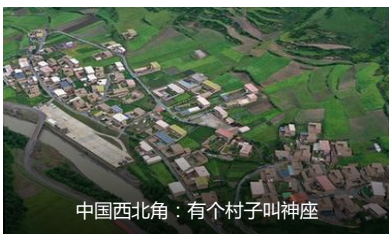
中国西北角：有个村子叫神座