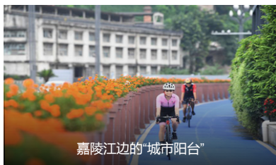
嘉陵江边的“城市阳台”