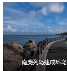
南麂列岛建成环岛