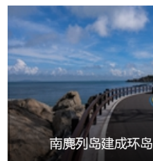
南麂列岛建成环岛